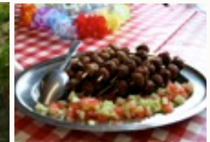
Ook de maaltijden zijn aangepast aan het thema.