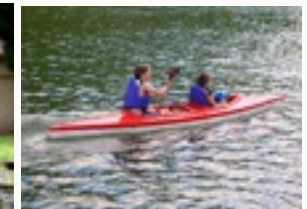
Kajakken op de Maas en afvaart van de Lesse.