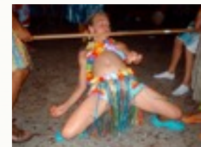
Themafuif met aangepaste muziek en animatie.