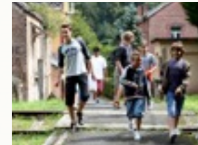
Fotozoektocht door het dorp van Waulsort.