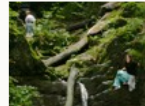
Bosspel aan de overkant van de Maas.