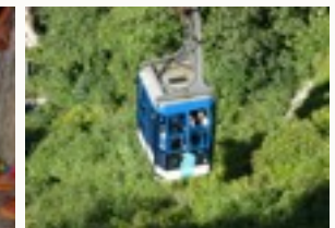
Dagtrip naar Dinant met bezoek aan de citadel.